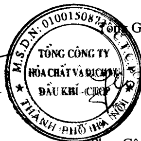
Phan Công Thành

Các thuyết minh đính kèm là bộ phận hợp thành của báo cáo tài chính riêng giữa niên độ này